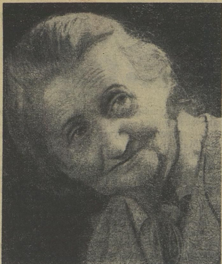
МОЯ БАБУСЯ — УЧИТЕЛЬНИЦА.