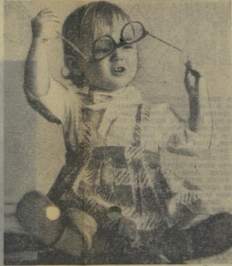
И Я ТОЖЕ БАБУШКА.