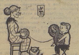
Рис. Г. КОВАНОВА.

Раньше жили мы в маленьком доме и все вместе. А недавно нам дали сразу несколько квартир в новом юбилейном доме... Так расселилась наша большая семья. А „виновница“ всего — бабушка. Она вырастила девять детей, а внуков и соснатать трудно. Кишворск, Вера Шаханова.