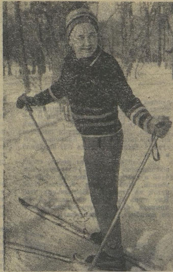
БАБУШКА — ЛЫЖНИЦА.