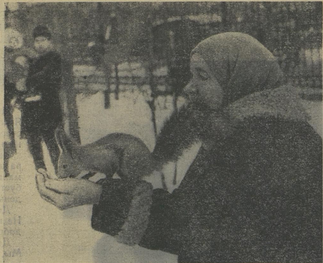
БЕЛОЧКА — ДРУГ БАБУЛИ.